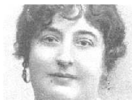
Carmen de Burgos